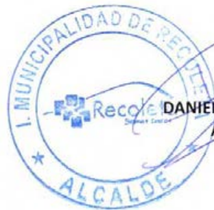
DANIEL JADUE JADUE ALCALDE